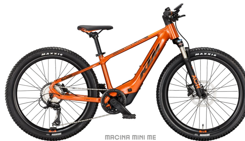
MACINA MINI ME 5X 24