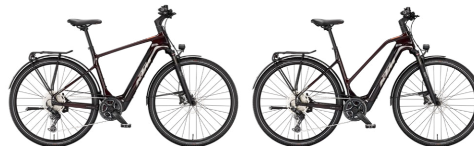
MACINA SPORT SX ELITE