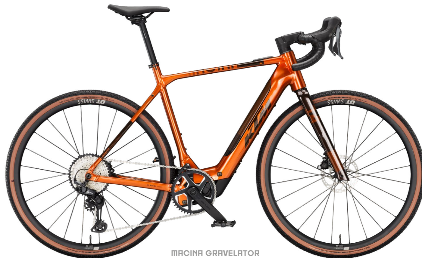
MACINA GRAVELATOR SX 10