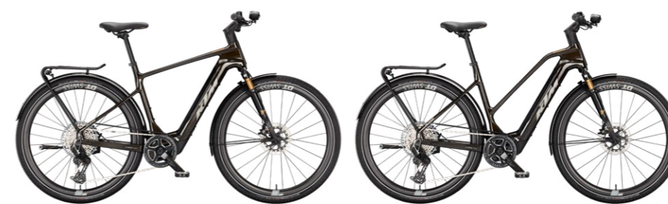
MACINA SPORT SX PRIME