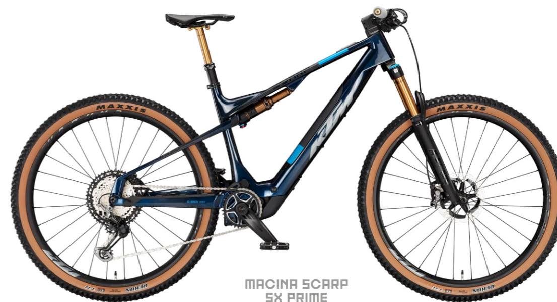
MACINA SCARP SX PRIME