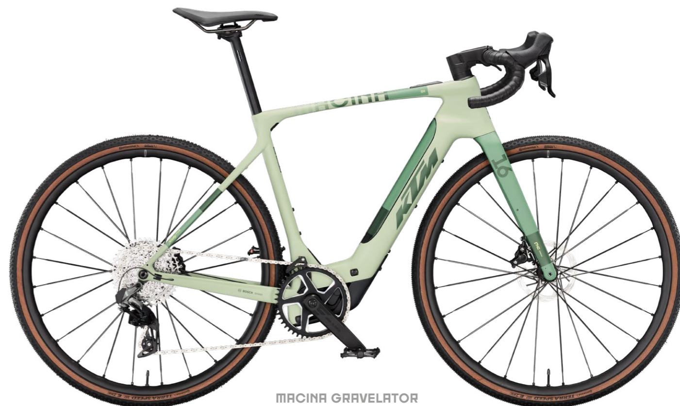
MACINA GRAVELATOR SX PRIME

We provide carbon and aluminium options in the E-Gravel Light Range. The Gravelator SX Prime and Gravelator SX 10 are the first-ever E-Gravel bikes in KTM's history. The new Bosch Performance Line SX motor provides assistance precisely when you need it. The modern-designed frame features internally routed cables through the headset, an integrated seat clamp, and ample tire clearance. This concept redefines gravel riding and expands the possibilities for utilizing these bikes.