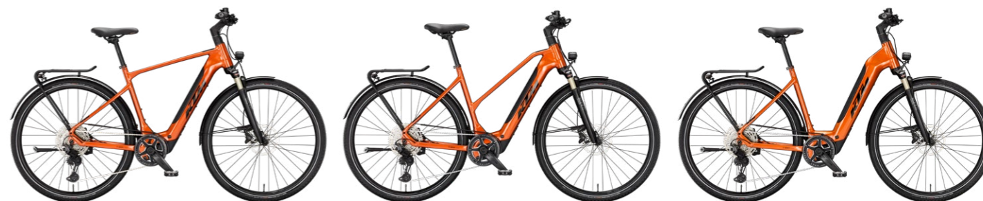
MACINA SPORT SX 10