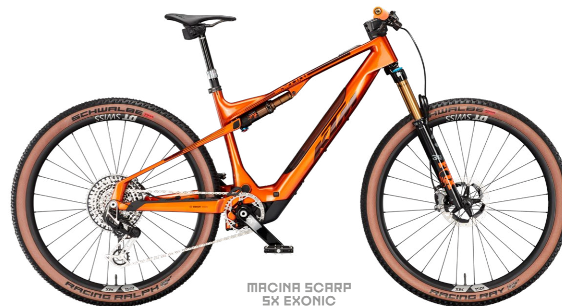
MACINA SCARP SX EXONIC

The name Scarp is well known to all race-fully lovers. The carbon top athlete is now available, thanks to lightweight SX Drive Unit, also with motor. In the three different Scarp SX models, the best features of two worlds were combined. 140mm travel provide extra trail fun and some enduro feeling.