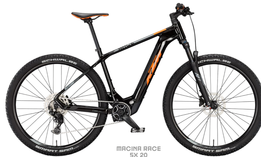
MACINA RACE SX 20