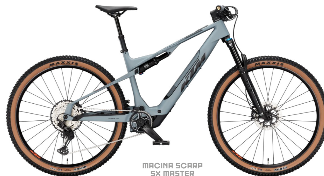
MACINA SCARP SX MASTER