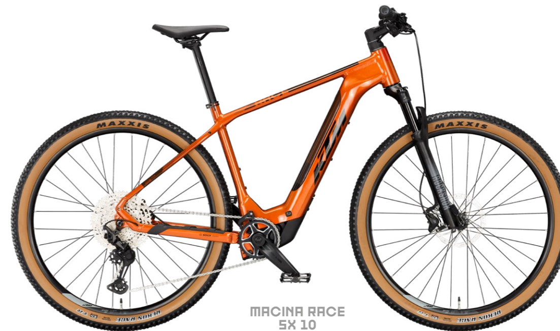
MACINA RACE SX 10

The new KTM Light E-Bike range features three Race SX hardtails. These bikes are characterized by their lightweight aluminum frame, including a compact motor bracket unit. In conclusion, the Race SX models are the perfect bicycles for entry-level sporty e-MTB riding. The low total weight guarantees fun both on and off the paved roads.