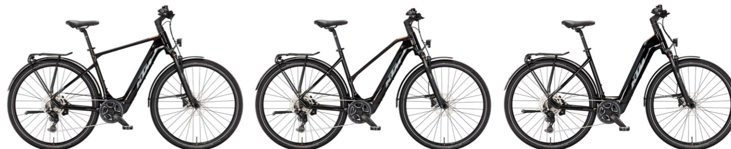
MACINA SPORT SX 20