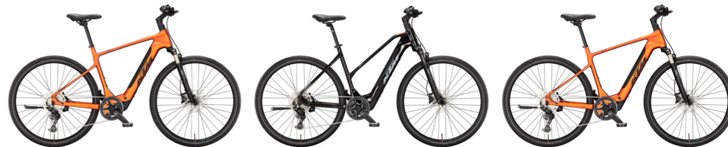
MACINA CROSS SX 20