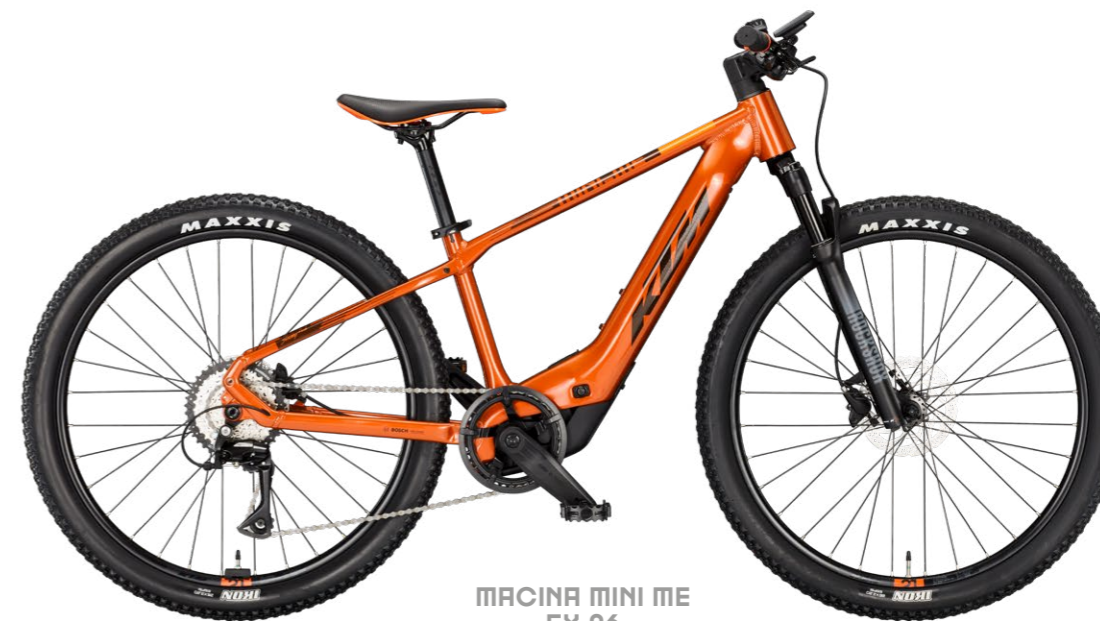
MACINA MINI ME 5X 26

The year 2015 saw the exciting launch of the KTM MINIME, the first kid's eBike created for our product range. An innovative product was pioneered over the years to make it welcomed by society. The introduction of the BOSCH SX Drive Unit represents the next stage of evolution for the Mini Me 24 and 26-inch bikes. The primary focus during the development of the new frame concept was on reducing the weight of the bicycle and improving its handling. By integrating the fixed CompactTube 400WH battery, the frame weight was significantly reduced. A closed, tapered, and hydroformed down tube, which also houses the motor, enables a lightweight frame and a more compact, child-friendly geometry.