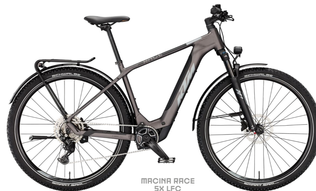
MACINA RACE SX LFC