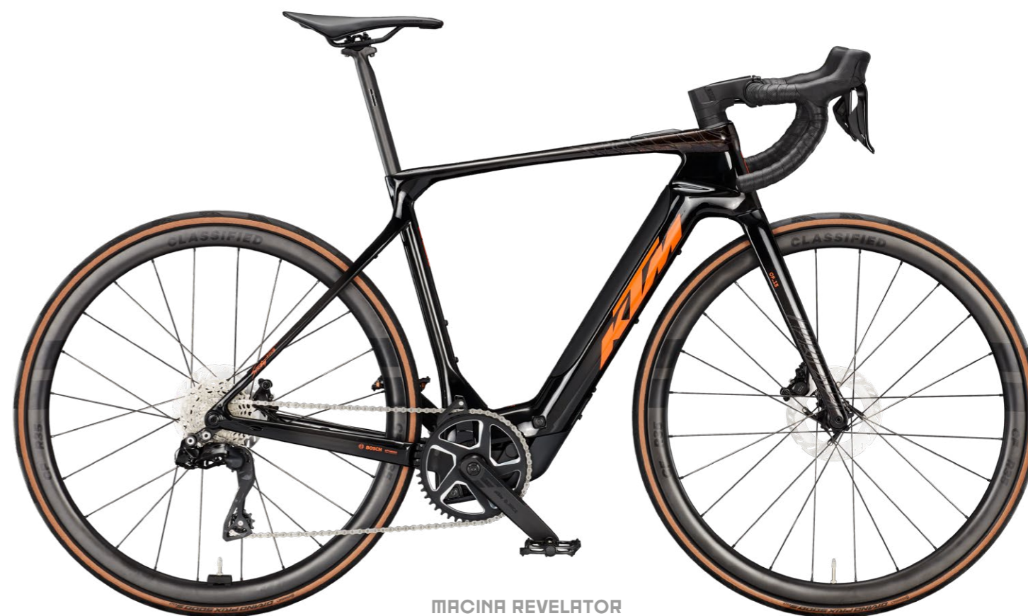
MACINA REVELATOR SX PRIME

The KTM-Carbon-E-Roadbike offers a thrilling road riding experience for a wide range of cyclists. The new Bosch Performance Line SX motor provides smooth and natural assistance, precisely when you need it. Tired legs will no longer be an issue. The carbon frame features an aerodynamic design approach, internally routed cables through the headset, and an integrated seat clamp. The Classified hub provides an extensive range of gears. With this concept, the E-Roadbike is both technologically advanced and visually appealing, representing the ease and joy of cycling.